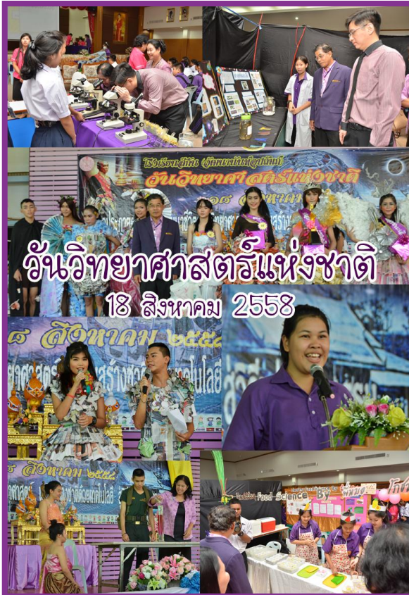
งานวิทยาศาสตร์แห่งชาติ 18 สิงหาคม 2558