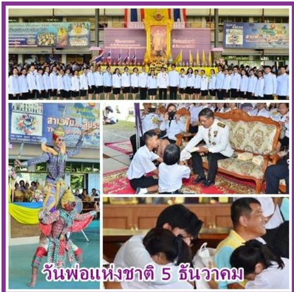
วันพ่อแห่งชาติ 5 ธันวาคม