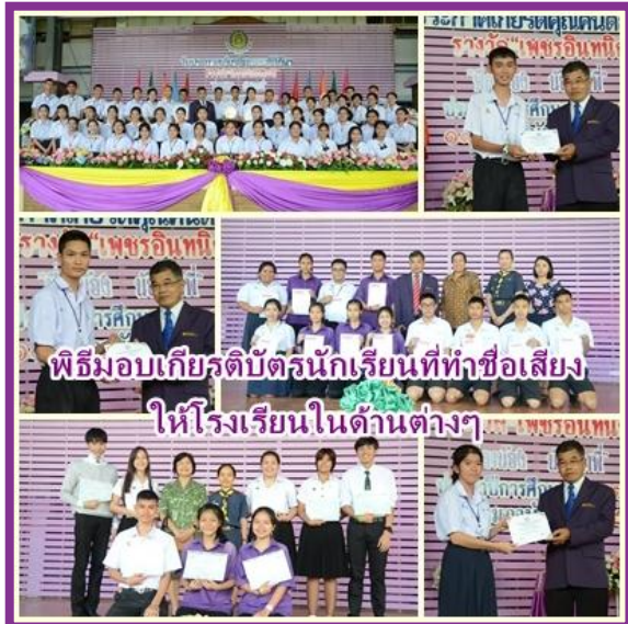
พิธีมอบเกียรติบัตรนักเรียนที่ทำชื่อเสียงให้โรงเรียนในด้านต่างๆ