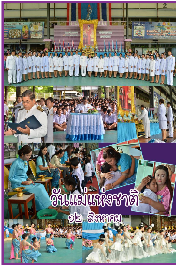
วันแม่แห่งชาติ ๑๒ สิงหาคม