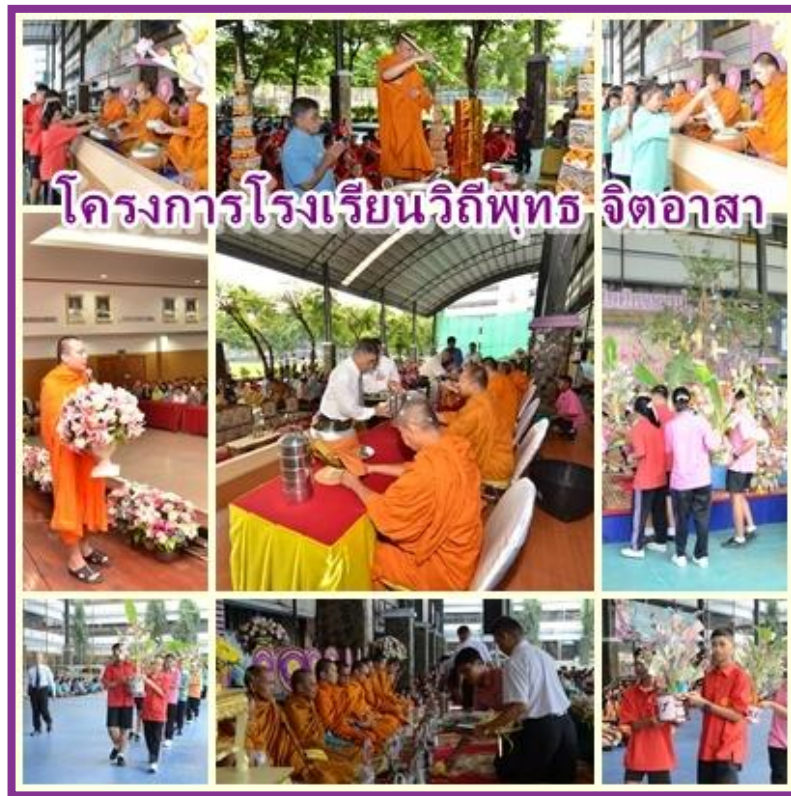
ภาพประกอบมาตรฐานด้านมาตรการส่งเสริม